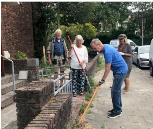
De tuinclub aan het werk

In 2022 is de mogelijkheid geopend om Vriend van Amadeus te worden. Ongeveer 100 wijkbewoners hebben hun betrokkenheid bij Amadeus getoond door zich aan te melden als vriend en een eenmalige of periodieke financiële bijdrage te leveren.