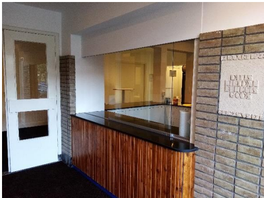
Gerennoveerde entree en receptie