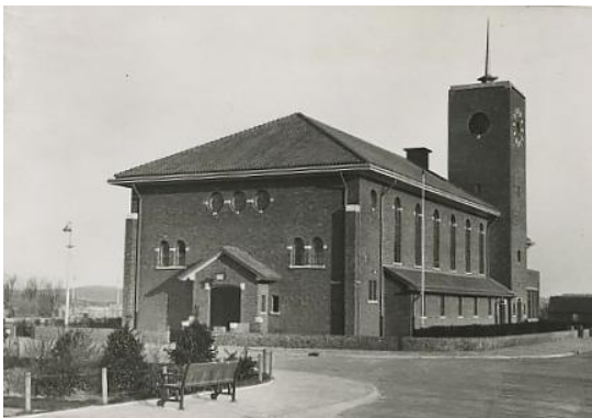
De Bethelkerk in 1938

In 2018 verkocht de Protestantse Gemeente 's-Gravenhage het kerkgebouw aan een projectontwikkelaar. Deze liet door een architect een ontwerp maken waarin de kerk deels een buurtfunctie (Amadeus) zou krijgen. Tevens zou een woonfunctie (groepswonen De Symfonie ) worden gerealiseerd, door op de plaats van het te slopen Gemeentecentrum en in een deel van de kerk 12 appartementen te bouwen.