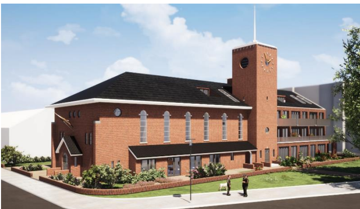
Ontwerp van de kerk en de appartementen