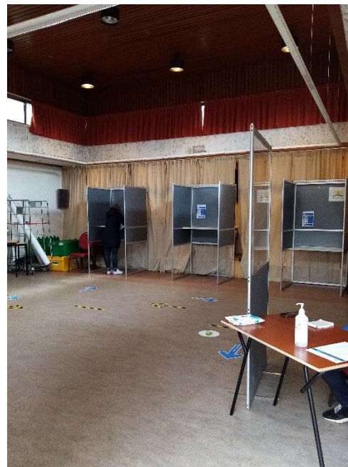
Amadeus als stembureau