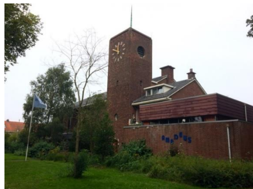
Bethelkerk en Gemeentecentrum in 2022