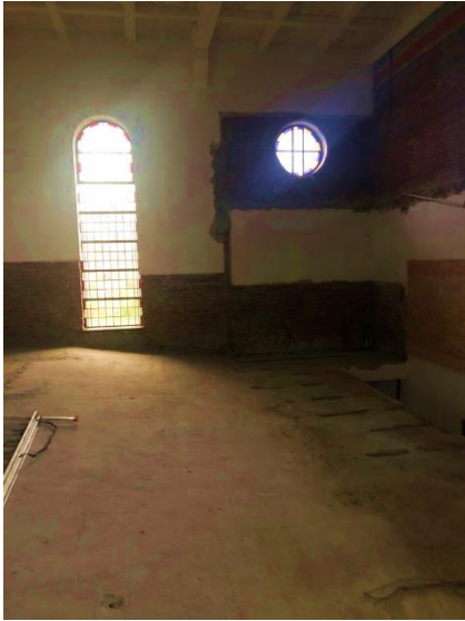
Balkonzaal vóór en na renovatie

De renovatie werd begeleid door de Amadeus Bouw Commissie . Deze bestond uit een interne 'projectmanager', een bestuurslid, enkele deskundige vrijwilligers en een horecadeskundige. De commissie adviseerde de eigenaar van de kerk en het bestuur van Amadeus tijdens de renovatie.