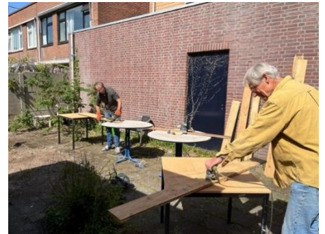
Vrijwilligers aan het werk