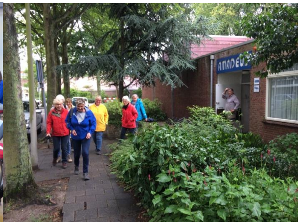
Vertrek van een wandelgroep