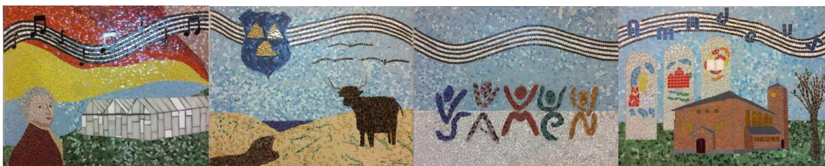
Het complete Amadeus-mozaïek. Het rechterpaneel is vergroot weergegeven op de titelpagina van dit jaarverslag

Loosduinen Gaat Los. In het kader van samenwerking binnen het stadsdeel Loosduinen wordt jaarlijks het festijn Loosduinen Gaat Los georganiseerd. In dit kader werd in Amadeus in 2019 samen met CultuurSchakel Loosduinen een zeer succesvolle kunstmarkt gehouden. Helaas gooide in 2020 corona roet in het eten, maar in 2021 hopen we weer van de partij te zijn.