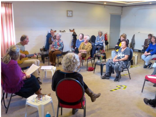
Een culturele middag in Amadeus

Zie voor het overzicht van de activiteiten die in 2020 plaatsvonden, het schema in de bijlage .