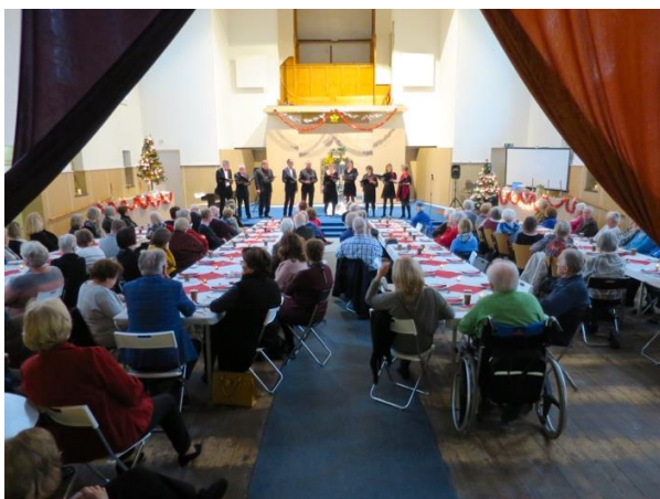
Kerstdiner 2019 in de kerkzaal

Amadeus wil een ontmoetings- en activiteitscentrum zijn en als huiskamer fungeren voor de wijkbewoners. De wijk rond de voormalige kerk is sterk vergrijsd. Veel wijkbewoners zijn alleenstaand. Een activiteitscentrum ontbrak, zeker nadat de Protestantse Gemeente de kerk verliet. Een vertrouwde plek in de wijk waar men elkaar kan ontmoeten, zal vereenzaming tegengaan en de sociale cohesie versterken.