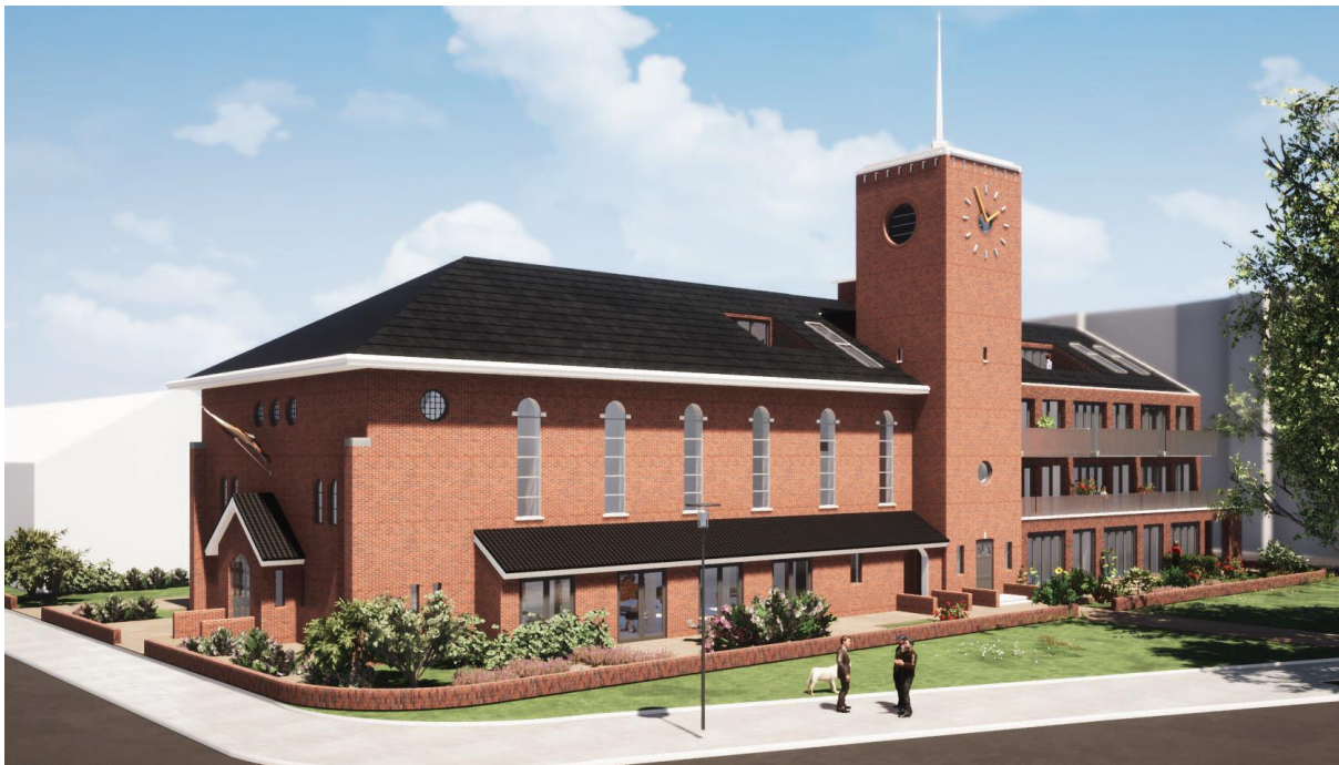
Ontwerp van de kerk en de appartementen