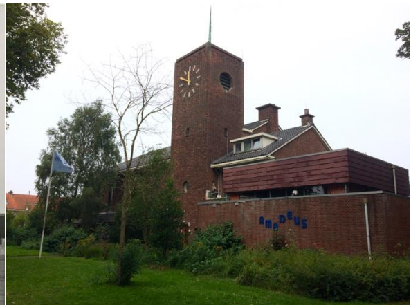
Bethelkerk en Gemeentecentrum in 2020