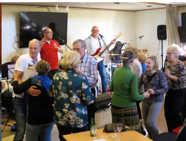
Dansen in het Muziekcafé