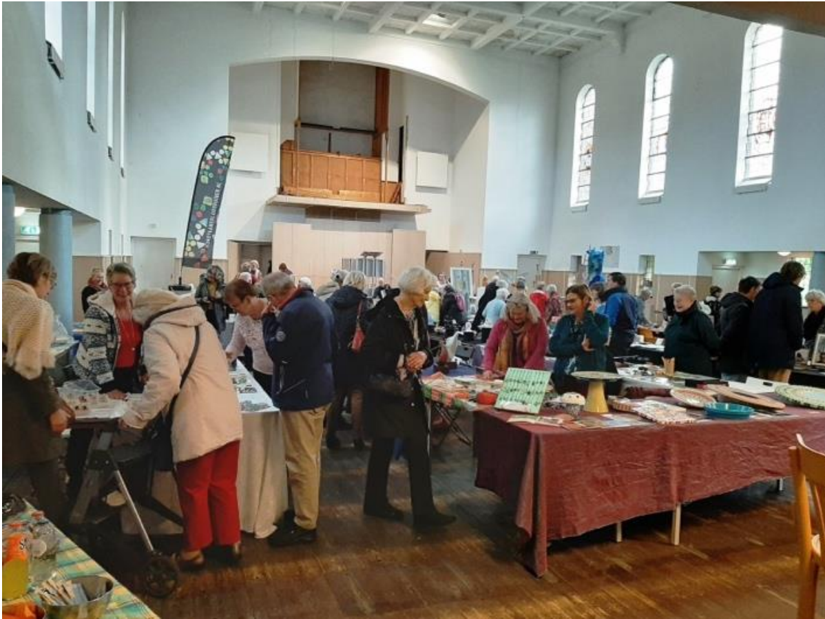
Kunstmarkt in 2019