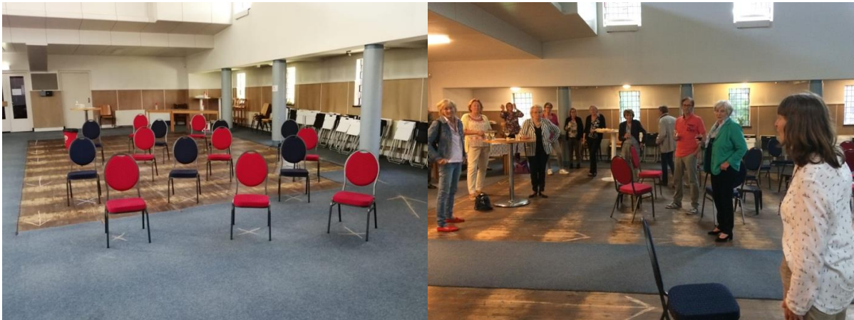
Alle activiteiten op veilige afstand in tijden van corona!

De vrijwilligers ontvangen regelmatig hun digitale krant, De Troubadour .