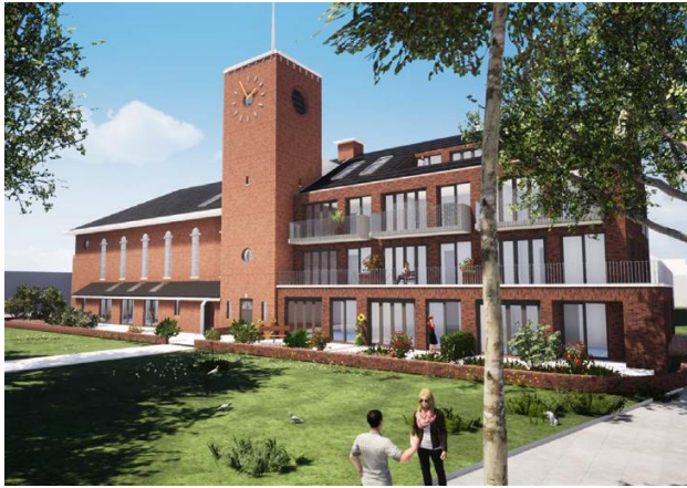
De Bethelkerk in de toekomst?