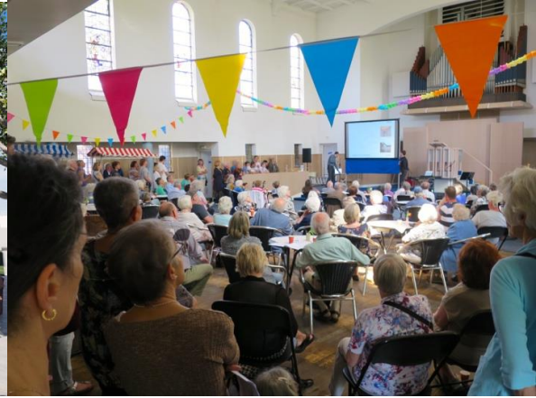
Informatiemiddag voor buurtbewoners