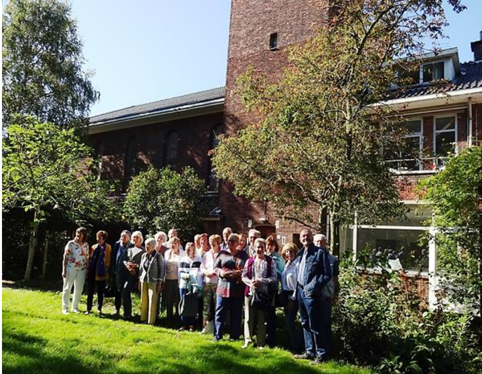
Een deel van de vrijwilligers