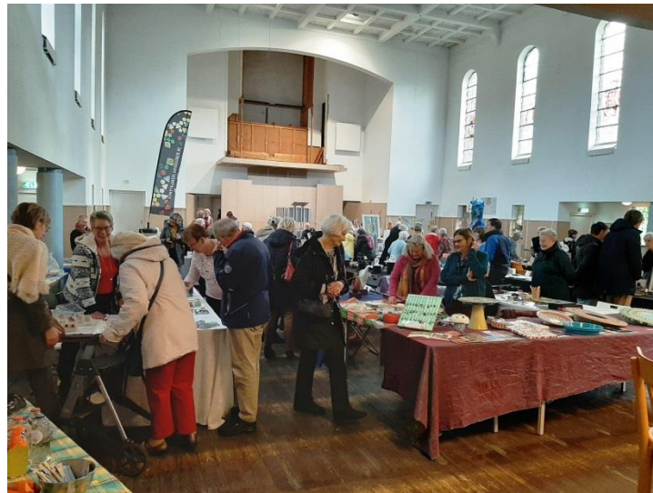
Kunstmarkt in het kader van Loosduinen gaat los!

In het kader van Loosduinen Gaat Los 2019 werd in samenwerking met de leden van de Kunstkamer Loosduinen een kunstmarkt georganiseerd.