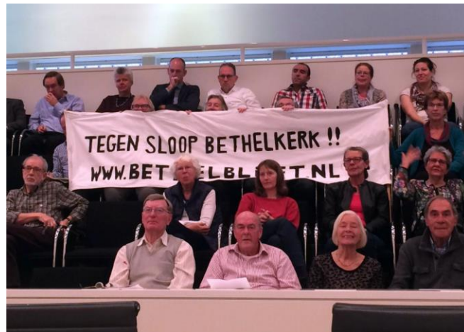
Raadzaal gemeente Den Haag

De buurt werd via informatiebijeenkomsten steeds op de hoogte gehouden van de voortgang van de acties.