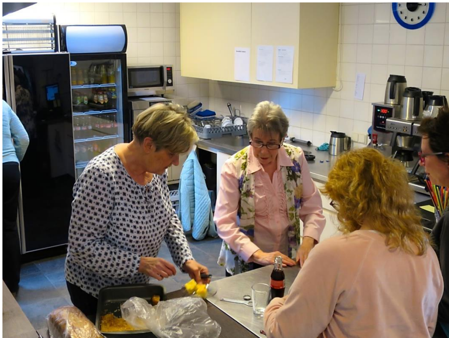
Vrijwilligers actief in de keuken