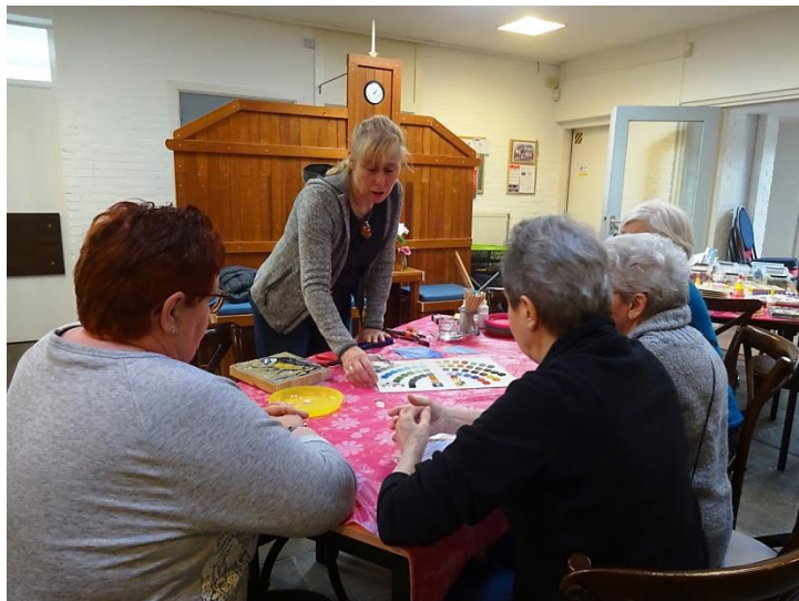
Mozaïek voor Amadeus

Buurtbewoners kunnen tevens bij ons terecht voor verjaardagen, kinderpartijtjes, conferenties en VvE-vergaderingen. Organisaties houden in Amadeus koor- en orkestrepitities en uitvoeringen. Een doktersnetwerk houdt