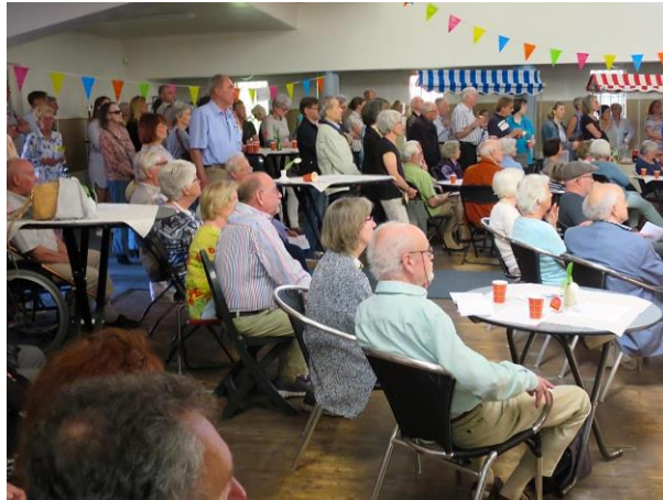
Wijkbewoners op een van de informatiebijeenkomsten

Wijkbewoners worden geregeld op de hoogte gehouden van de voortgang van de bouwplannen.