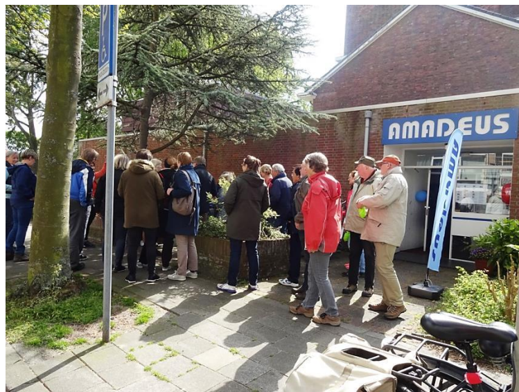
Dinsdagmiddag wandeling in het kader van de Nationale Diabetes Challenge

In 2020 wordt onder leiding van een van de Amadeus-vrijwilligsters gestart met een wandelgroep. Na afloop wordt in Amadeus met elkaar wat gedronken met wat lekkers er bij.