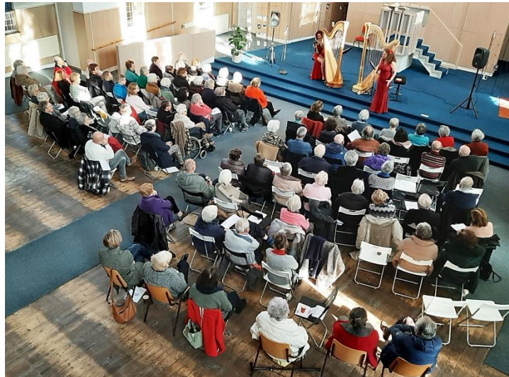
Optreden leden Residentie Orkest