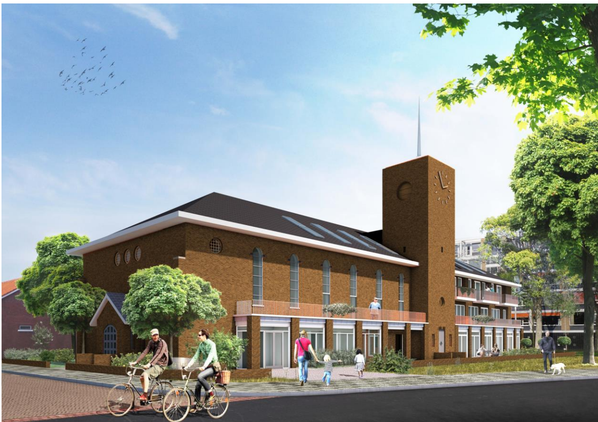
Impressie verbouwing van de kerk

Gezien de tijdelijkheid en gemeentelijke planvorming rond verkoop van Wings kunnen de gebruikers na voltooiing van de verbouw van Amadeus in Amadeus gehuisvest worden. Hiermee is rekening gehouden in het programma van eisen.