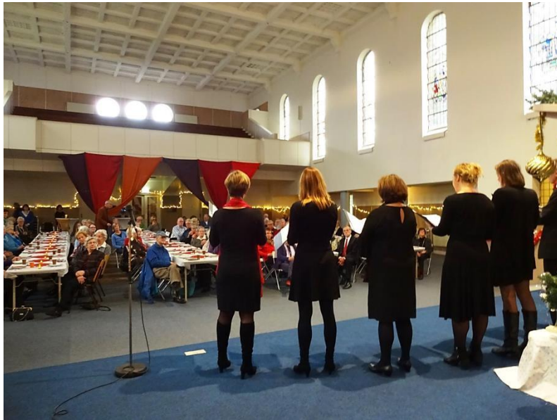
Kerstbijeenkomst met ruim 100 wijkbewoners

frequent bijeenkomsten en ook andere netwerken weten Amadeus te vinden. Vrouwen van Nu en het Humanistisch Verbond houden bijeenkomsten, lezingen en cursussen bij Amadeus.