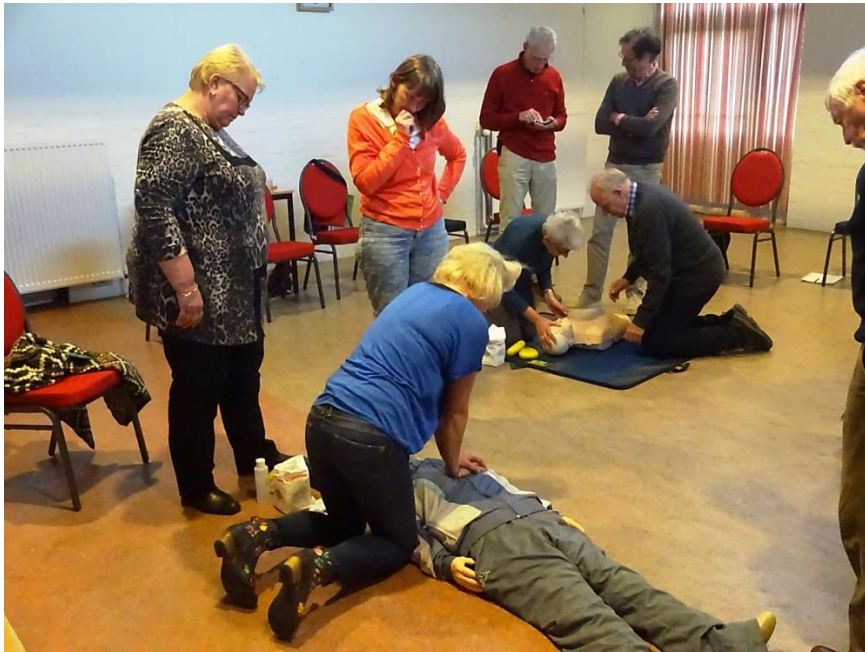
AED-training door vrijwilligers