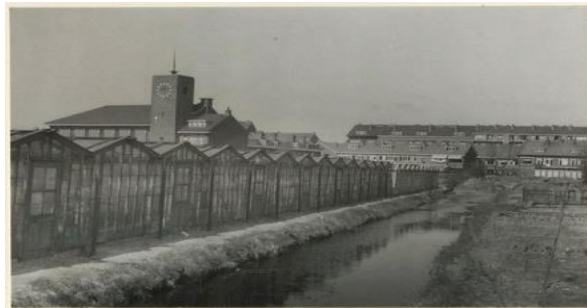
Bethelkerk rond 1940

Op 12 maart 1938 vond de eerst steenlegging plaats. De officiële ingebruikname was in december 1938. In 1965 werd het zogenaamde gemeentecentrum aangebouwd.