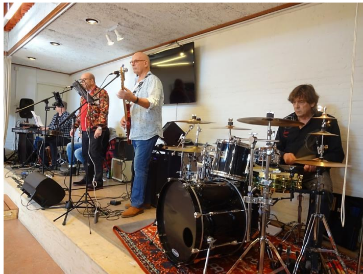
Optreden van de band The Nowhere Café tijdens muziekcafé Amadeus op Zondag!